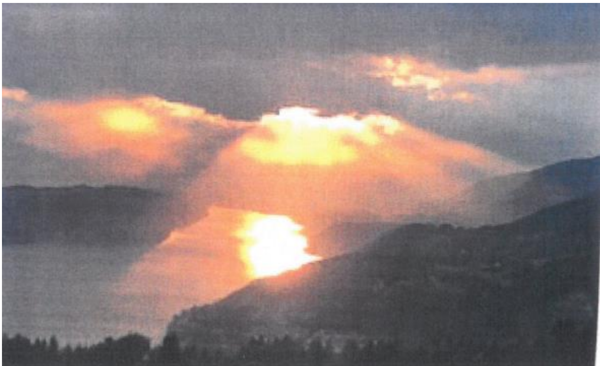
ein herzlicher „Lichtgruß“ aus Kärnten

Das SEMINAR beginnt am Montagabend, den 24. Oktober 2022 um 20 Uhr und endet am Samstagmittag den 29. Oktober 2022 um 11 Uhr.