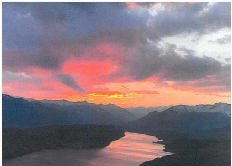
Sonnenuntergang am hochenergetischen Seminarort